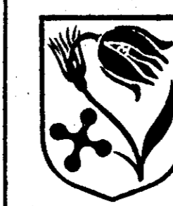
TAVOLA n. 1.